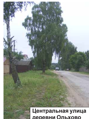
Центральная улица деревни Ольхово

- Зима - это время серьезных испытаний. В конце января, когда было минус 25, на мушковичских сетях произошла авария - сразу два порыва из-за подвижек грунта. Помню, как сложно было найти технику в такой мороз. Но ведь делать надо, люди остались без воды. Спасибо руководителю фирмы «Техсила» С.В.Капризову, предоставившему нам тогда экскаватор. Сложно, конечно. Ты понимаешь, что