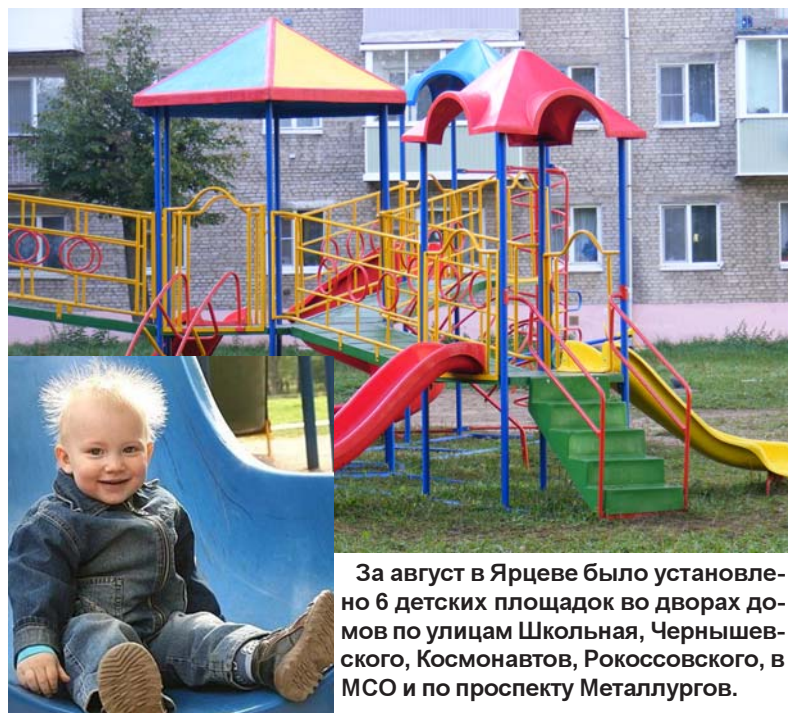
За август в Ярцеве было установлено 6 детских площадок во дворах домов по улицам Школьная, Чернышевского, Космонавтов, Рокоссовского, в МСО и по проспекту Металлургов.