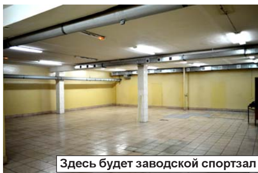
Здесь будет заводской спортзал